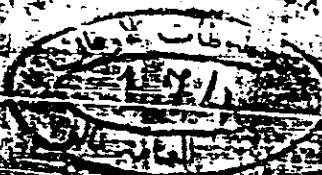
صفحة العنوان من النسخة (أ)